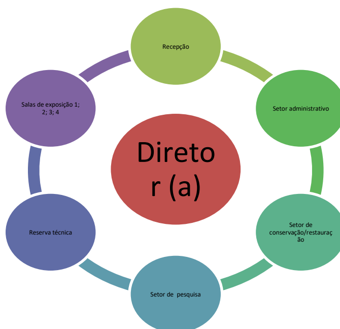
Figura 2: Ciclograma do museu.

A instituição seguirá as normas de estágio de acordo com a legislação vigente (Lei nº 11.788/2008) e Orientação Normativa nº 4/2014. Ambas, se complementam para assegurar tanto aos estagiários quanto aos órgãos públicos e privados a garantia de uma prática que consolide a formação teórica do estudante para ingressar ao mundo do trabalho.